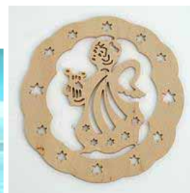
Детали из дерева