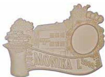
Восковая литьевая модель