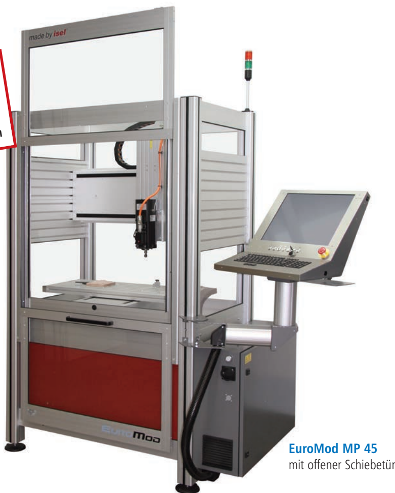
EuroMod MP 45 mit offener Schiebetür